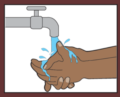
1. በመጀመሪያ እጀዎን በውሃ ያርሱት