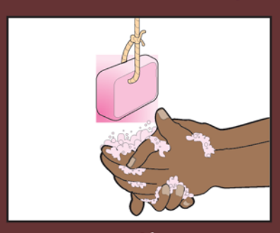
2. በመቀጠል እጀዎን በሞሳ በሳሙና ወይም በአመድ ተቁልቀለይ