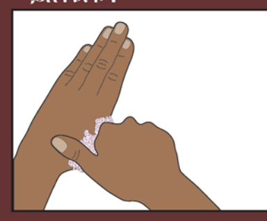
7. የእጀዎን አውራ ጣት በማቀያየር በደንብ ይሹት